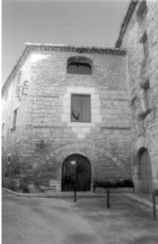
"La Casa de les Orenetes", el nostre local al carrer del Puig, número 4

Els Pirineus s'han tornat petits i els Alps també; cal anar més lluny, i el 1986 es participa en l'expedició al Kangchenjunga; el 1987, s'organitza l'expedició Yanganuco-87; el 1990, es fa el Denali-Mckinley a Alaska; el 1991, el Makalu, entre el Tibet i el Nepal; el 1992, l'expedició Àrtica-92; el 1993, Baltistan-93; el 1994, l'Operació Andes Xilens; el 1996, es participa en l'Expedició de Girona a l'Everest; el 1997, en l'expedició juvenil als Andes de Bolívia; el 1998, Banyoles-8000-Broad Peak; el 2001, el Mustagata 7546, a la Xina, i el 2002, el Shisha Pangma 8024, que suposa assolir per primera vegada un vuit mil i precisament l'any del cinquantenari.