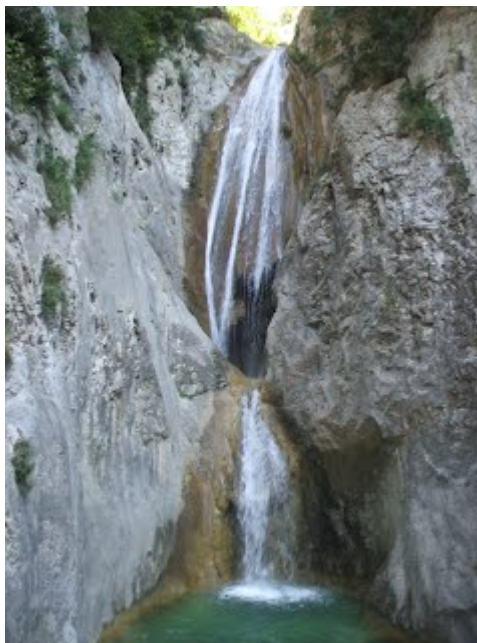
Salt del Brull, final de la Pujada

L'any 1961 es comença la PUJADA NEDANT A SANT ANIOL. Algunes vegades s'hi organitzen concursos de vestits de bany d'època i arrossades populars. Per la poca assistència i també per les responsabilitats que comporta el difícil control dels participants es deixa de fer al cap de vint-i dos anys. Al desembre, comença la que ara ja és tradicional portada anual del PESSEBRE AL BASSEGODA, amb vivac inclòs.