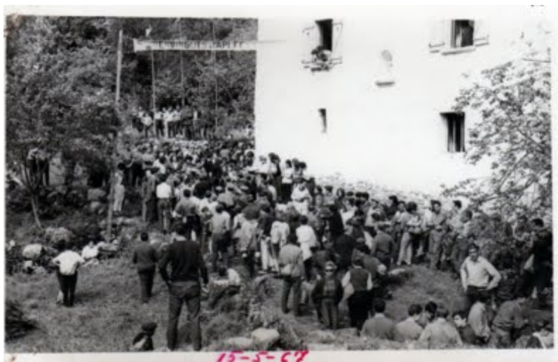
El refugi de Sant Aniol

L'any 1957, després de molts esforços, treballs i dedicació personal d'un bon grup de persones de l'entitat i també alienes, es va inaugurar el REFUGI DE SANT ANIOL D'AGUJA, i es recuperà la celebració del secular APLEC DELS FRANCESOS, interromput pel llarg període de guerres que acabava de viure Europa. A la diada de l'Aplec de 1962 es va col·locar la campana Coral·lí. El nom escollit va servir per homenatjar l'escriptor olotí Marià Vayreda que amb la seva novel·la "La Punyalada" descrivia molt bé aquelles contrades i les seves gents.