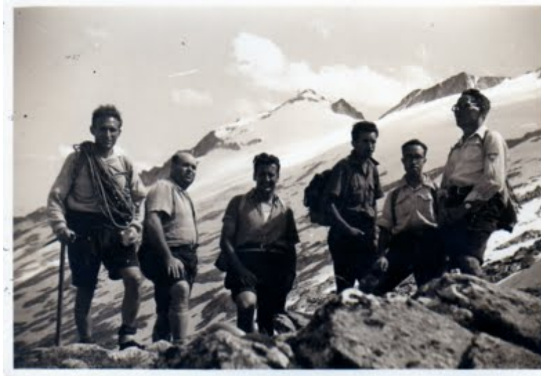
A punt de pujar la gelera

Els anys previs al Centre, es col·loquen les campanes a Rocacorba i a la Mare de Déu del Mont, a dintre dels actes d'aplecs molt concorreguts. Les excursions en general es limiten a la comarca i també alguna a la Garrotxa, i el mitjà de transport més habitual, era la bicicleta. D'aquesta època, no podem deixar de parlar de l'excursió emblemàtica que va suposar la PUJADA A L'ANETO feta el juliol del 1952 . En aquella època, amb els mitjans de que es disposava, era tota una proesa. Avui seria una "matinal" per a gent preparada. Al cap d'uns mesos, es va fer una conferència explicant amb detalls totes les vicissituds viscudes. Era la primera xerrada d'un seguit que s'han anat fent. Les tècniques audiovisuals han anat millorant, tot i que l'esperit engrescador i divulgador de les activitats ha estat sempre el mateix.