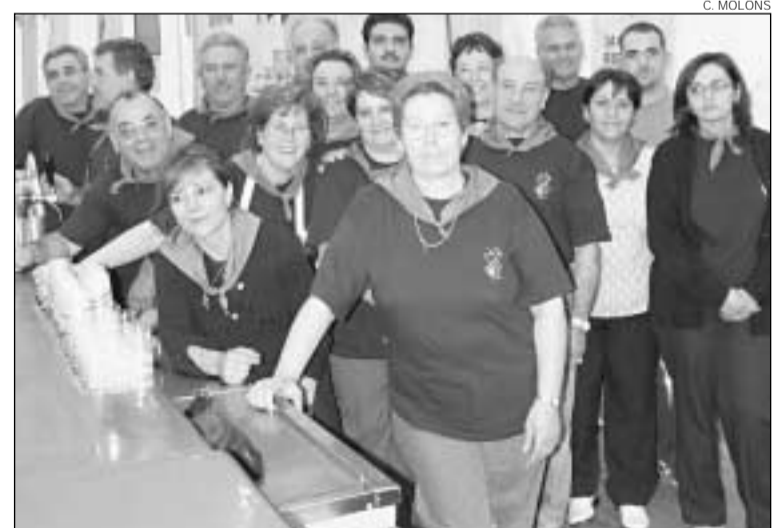
Carpa de fires. Es tornarà a instal·lar enguany al mateix espai.

La Casa d'Andalusia està ultimant els preparatius per a la celebració del Dia d'Andalusia, el proper 28 de febrer, amb un conjunt d'actes que s'allargaran durant tot el cap de setmana. Divendres tindrà lloc, a l'actual seu, una recepció oficial amb parlaments, mentre que dissabte tindrà lloc una trobada amb un espectacle d'artistes de cançó espanyola. Per al proper diumenge 2 de març, es preveu una missa cantada a la parròquia del Bon Pastor, i tot seguit, un dinar popular obert a tothom.