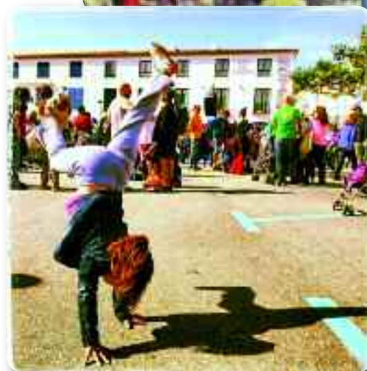
Fotografies guanyadores del 1r i 2n premi