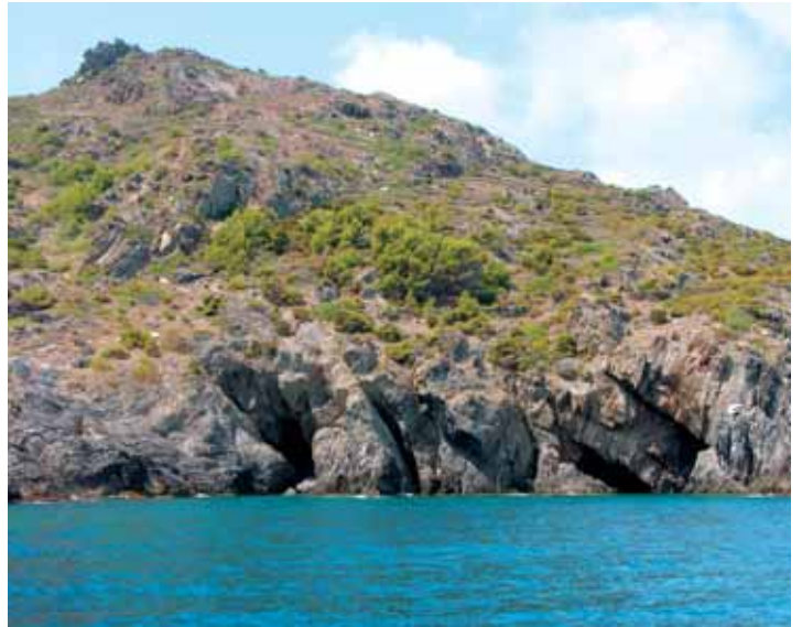
Vista del tram de les Covasses per on transcorre el camí de ronda de cala Tamariua a cala Fornells

Paral·lelament, el Ministerio de Medio Ambiente ha adjudicat l'execució de les fases 1 i 2 del camí de ronda que connecten el de Llançà amb s'Arnella per un import de 569.129,33 €