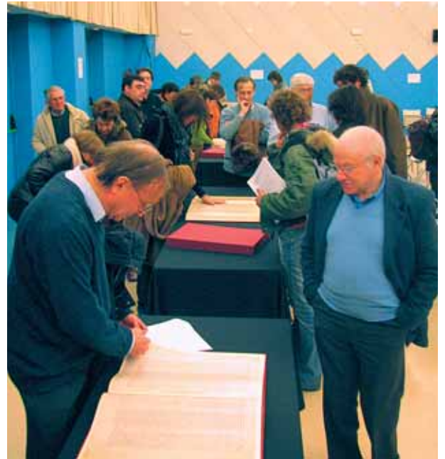
Els assistents consultant un dels facsímils de la Bíblia

Per acabar la jornada del dia 15 dedicada a la Bíblia, i tancar les primeres Jornades de Patrimoni del Port de la Selva, es va presentar la reproducció facsímil de la Bíblia de Rodes. Una obra inèdita, de tiratge reduït, que