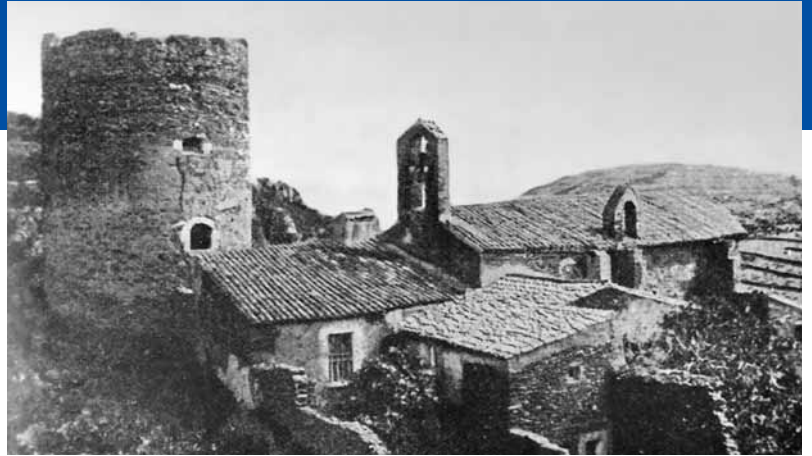
Imatge de Sant Baldiri abans de 1920

Complementant els actes tradicionals de la festa major de Sant Baldiri des de l'Ajuntament, i aprofitant les importants obres de consolidació, restauració i la campanya arqueològica feta a l'ermita de Sant Baldiri de Taballera, hem pensat que estaria molt bé anar-hi tots junts a passar el dia. Els que vulgueu podeu fer l'excursió a peu, els que us costi més amb cotxe, ja que habilitarem una zona d'aparcament. Hi haurà activitats per a tothom. Si voleu participar del dinar popular, cal que prèviament compreu un tiquet a l'Ajuntament i us porteu plat, got i coberts; si us convé, també taula i cadires. Si dineu pel vostre compte, recordeu que està prohibit encendre foc, fins i tot amb barbacoes de tres peus. Us hi esperem. Aquest any, Sant Baldiri més que mai!!!