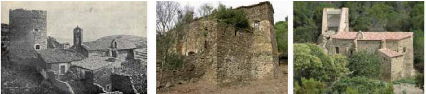
Sant Baldiri de Taballera, 1911, 2005 i 2008.

Durant el període 2005-2008, l'Ajuntament del Port de la Selva va realitzar un seguit de treballs de consolidació, rehabilitació i recerca. Entre aquests treballs hi havia les excavacions arqueològiques del conjunt de Sant Baldiri.