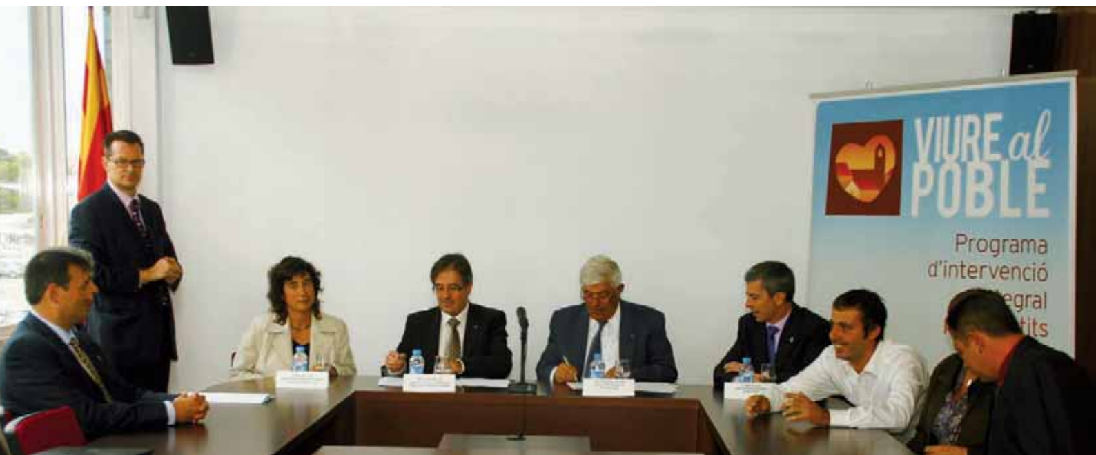
Sgnatura del conveni de col·laboració.

Un total de 26 municipis de Catalunya realitzaran projectes dins del programa Viure al Poble . El projecte del Port de la Selva, juntament amb el de Vilajuïga, són els dos projectes seleccionats per al programa Viure al Poble de la comarca de l'Alt Empordà.