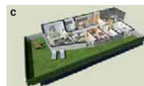
Exterior edifici i seccions pis tipus A, B i C