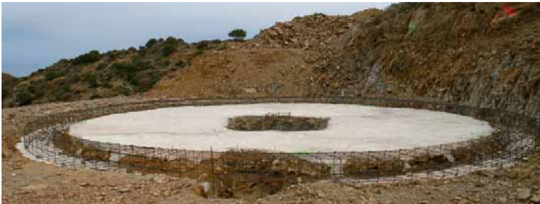
Base de l'estructura del nou dipòsit per a aigua regenerada del Mirador.

La segona obra està vinculada a l'ús de l'aigua regenerada. Com molt bé sabeu, el nostre municipi fou pioner en la instauració del tractament terciari de les aigües que arriben a la depuradora amb la implantació d'un sistema que permet obtenir una aigua que, amb els corresponents controls, pot ésser utilitzada per a usos no potables. Els treballs actuals preveuen la construcció d'una línia d'impulsió des de la depuradora fins a un dipòsit de nova construcció a la zona del Mirador II, i a partir d'aquest una línia de distribució que finalment estendrà els seus ramals fins a la carretera de Sant Pere, el pavelló i la Fonollera.