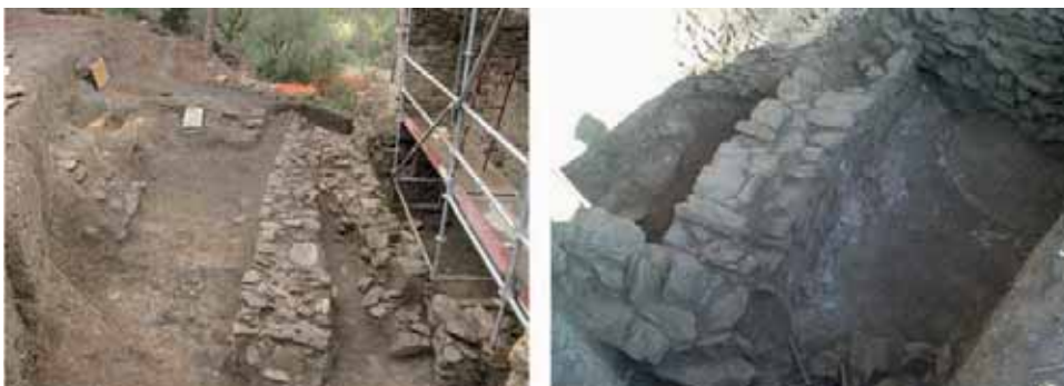
Dreta, espai funerari nord. Esquerra, cala amb estructures altmedievals. Paviment d' opus signinum .

Diferents elements posats al descobert el desembre del 2007 i el gener del 2008, com ara la tomba amb paviment de tàgula, l'aparició de molts fragments d'àmfora romana, alguns fragments de ceràmica sigil·lata, una estructura a sota de l'angle nord-oest de l'església i els murs amb el recobriment del paviment d' opus signinum davant de la torre, fan pensar en una possible ocupació tardoromana o altmedieval. Aquest aspecte queda poc definit en funció de la informació que disposem avui. La continuïtat de les excavacions i el treball de recerca esmentat poden explicar què va passar a casa nostra entre l'època dels dòlmens i menhirs que trobem en abundància en la serra de Rodes i en el sector occidental del massís del cap de Creus i el període medieval i modern tan ben representat amb el conjunt de Sant Pere de Rodes, Santa Helena i el poblat de Santa Creu, Sant Salvador de Verdera, Sant Baldiri de Taballera, i el paisatge fortament humanitzat amb la presència de feixes, barraques de vinya i casals. També ens pot explicar el perquè dels 17 jaciments de pecis romans davant de les nostres costes i si tenien alguna relació amb la població autòctona del segle I i II dC de la Mar d'Amunt.