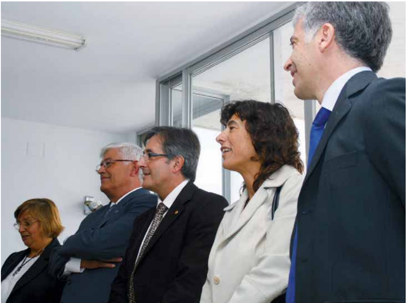
Les autoritats escolten el discurs de la presidenta de l'Associació Cultural Puig Gros a la Casa del Mar.