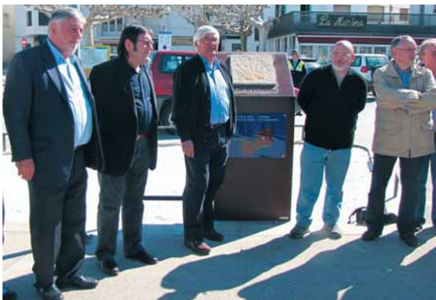
El monòlit d'inici del Camí amb les autoritats moments després de la seva inauguració.

El tram del camí que ens pertoca és el del Port de la Selva - Sant Pere de Rodes a Figueres. S'entén com a punt de partida o com a punt d'arribada. Suposen 29,7 km. Es calcula un temps de 8 hores per fer el recorregut.