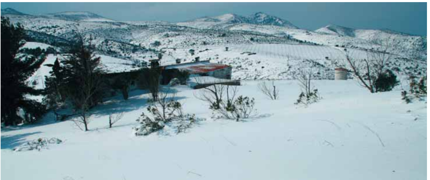
La zona de la Perafita va ser una de les darreres, conjuntament amb Sant Pere de Rodes, de recuperar la normalitat.

Des de l'Ajuntament, us volem donar les gràcies a tots per la vostra comprensió, comportament i civisme davant l'emergència, i molt especialment als que vàreu col·laborar i oferir el vostre suport per afrontar-la millor.