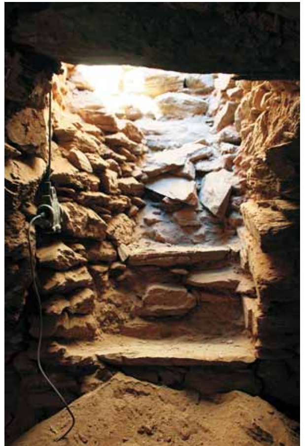
Accés al pis inferior de la torre de defensa localitzat en aquesta darrera campanya.