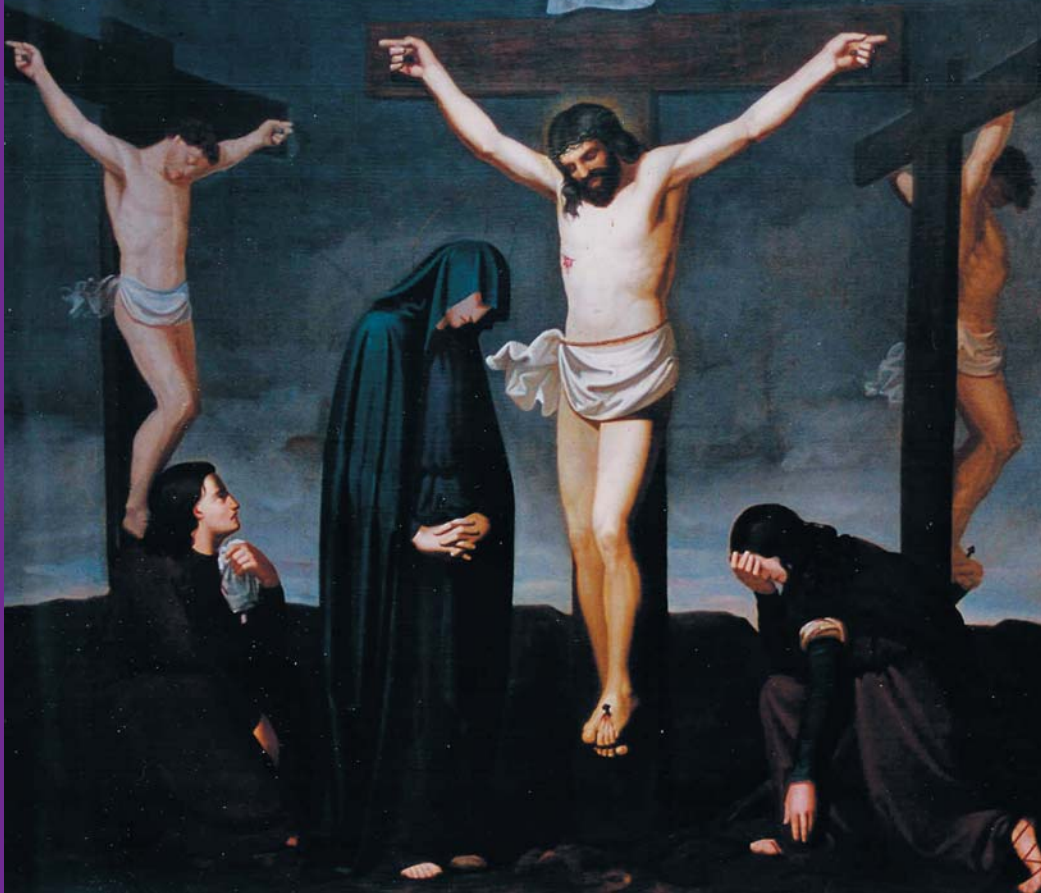
V Dolor - CRUCIFIXIÓ I MORT DE JESÚS A LA CREU