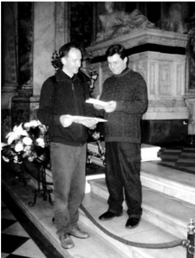
El prior, a la dreta de la imatge, rebent els llibres de la Congregació a l'altar de l'església de la Santíssima Anunciació de Florència.

Al convent, amb claustre del s. XV, hi conviuen 11 frares. És seu de la cúria provincial i centre d'acollida i formació de novicis: els futurs frares servites.