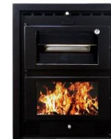
B-5HV ¡NOVEDAD 2015!