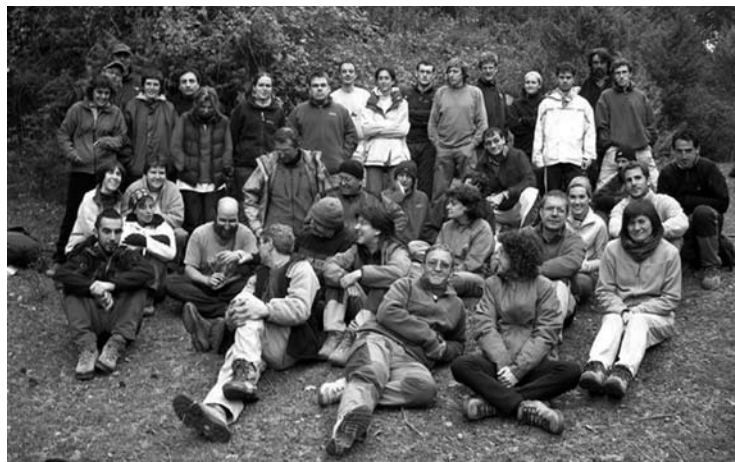
Foto de grup del dissabte.

A Rocabruna va haver-hi un altre mossec, aquesta vegada subvencionat pel CEB, amb ga-