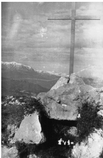
El primer pessebre

-Ja n'hi ha prou. Si no ho fem ara, no ho farem mai.