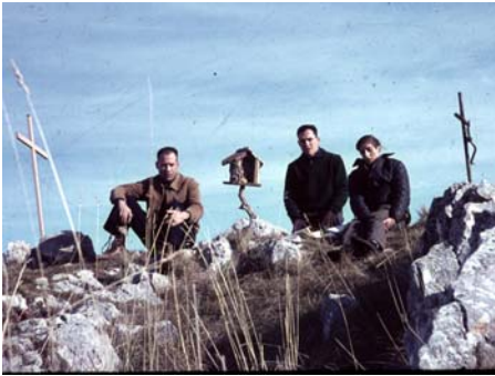
El segon pessebre

pujaren al cim a portar el pessebre. Tal i com es veu en la fotografia, varen construir una cova amb els rocs que hi ha al cim i ho adornaren amb les herbes que trobaren. Aquest fou el primer.