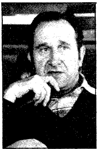
El senador Casademont