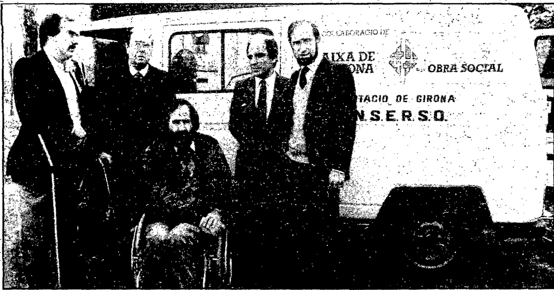
El nou vehicle està especialment preparat perquè hi puguin pujar nens amb defectes físics