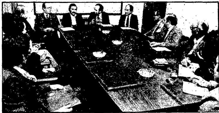
La signatura de la secció va tenir lloc a la Diputació de Girona

El nou cotxe costa un milió cent mil ptes. i ISERSO s'ha encarregat de fer les modificacions necessàries perquè pugui ser usat pels minusvàlids. D'altra banda la Diputació ha contractat els serveis del xofer, que cada matí recollirà els nens minusvàlids per portar-los fins a la nova