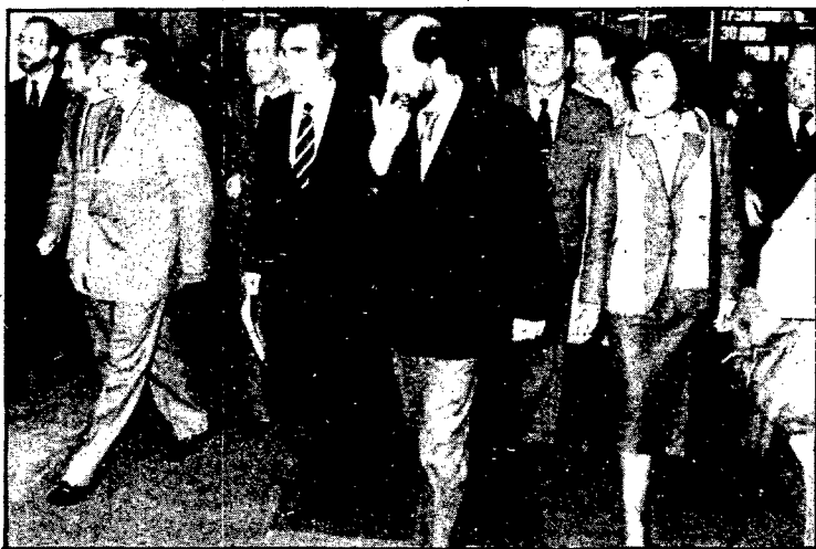
RODATUR ha estat la primera Fira turística en què ha participat l'Ajuntament de Girona i no serà pas la darrera

Aquest cap de setmana una delegació de la comunitat jueva a Barcelona visitava el call tot