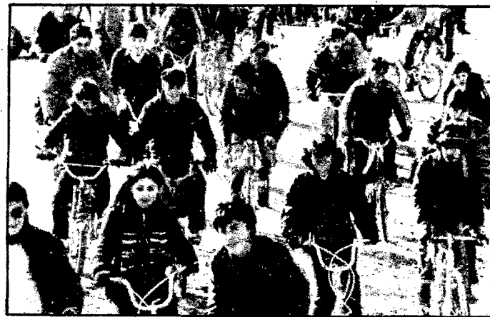
La Gran Bici, que marxa amb destí a Santa Afra, va recollir un gran nombre d'alumnes per a participar-hi

D'altra banda ahir al vespre i en presència de diverses autoritats es va procedir a la inauguració d'una gran exposició a la Casa de Cultura de la Diputació gironina. En aquesta mostra s'hi recullen treballs realitzats pels alumnes de les Escoles de Formació Professional de Girona, i un cop acabat l'acte es va fer una ballada de sardanes. L'exposició estarà oberta tota la setmana, i els propis alumnes explicaran la tasca concreta que ha desenvolupat en cada apartat dels que es mostren.