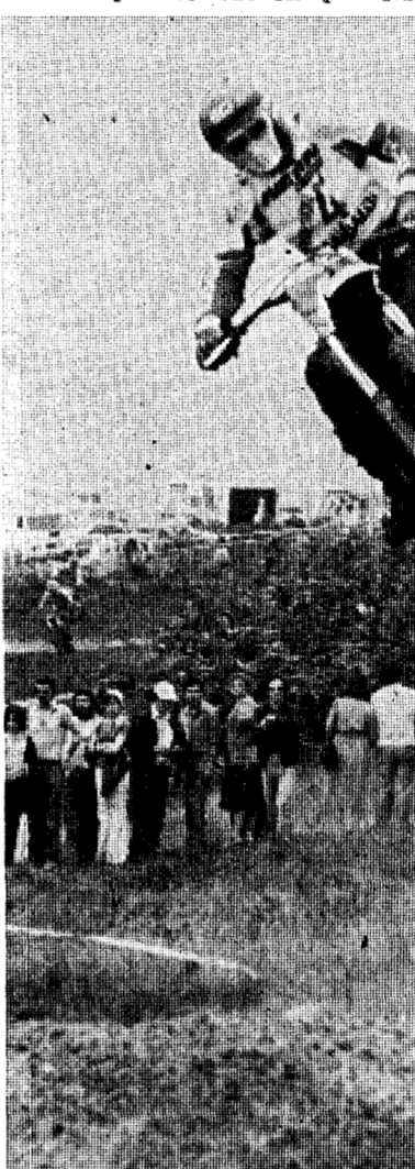
La espectacularidad del motocross se dará cita, el domingo, en Olot.

a la postre le supondría el doblete en el Campeonato de España de las categorías de 125 y 250 c. c.