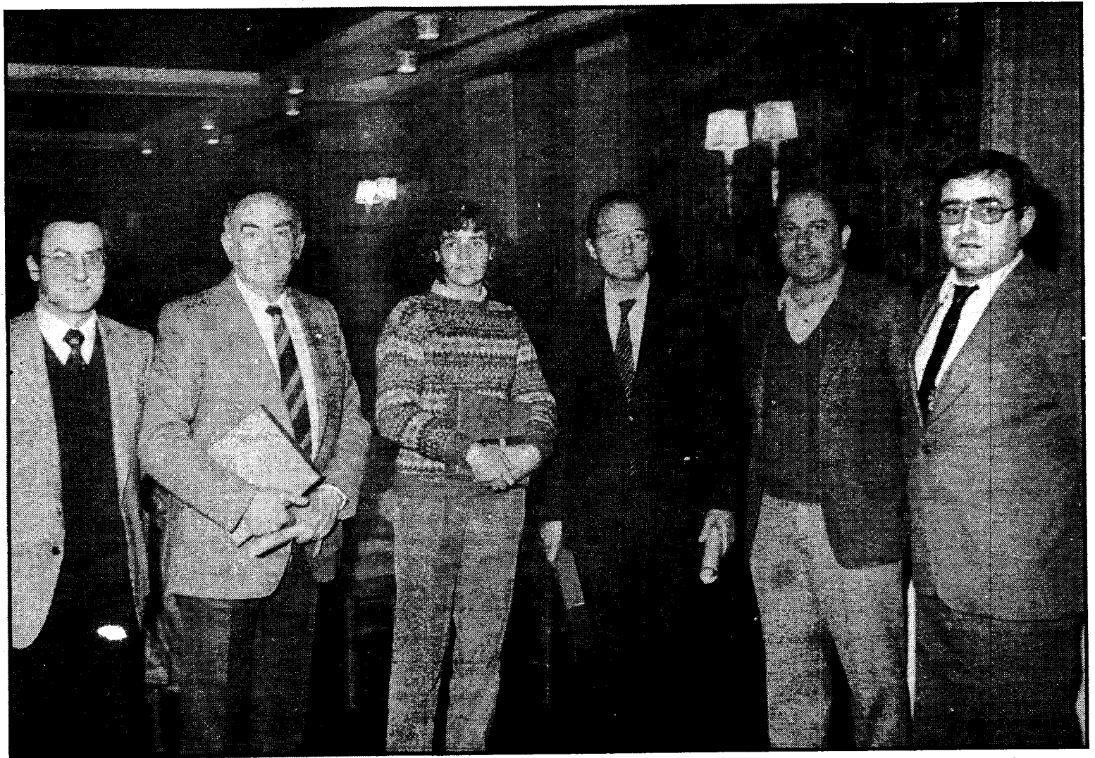
Esta noche elegiremos a los mejores del deporte gerundense en 1982 que tomarán el relevo de quienes obtuvieron el premio el pasado año.