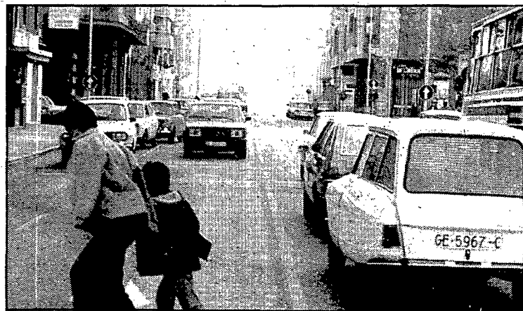
Treure la carretera N-II del centre de Girona fa bullir els cervells de polítics i tècnics.