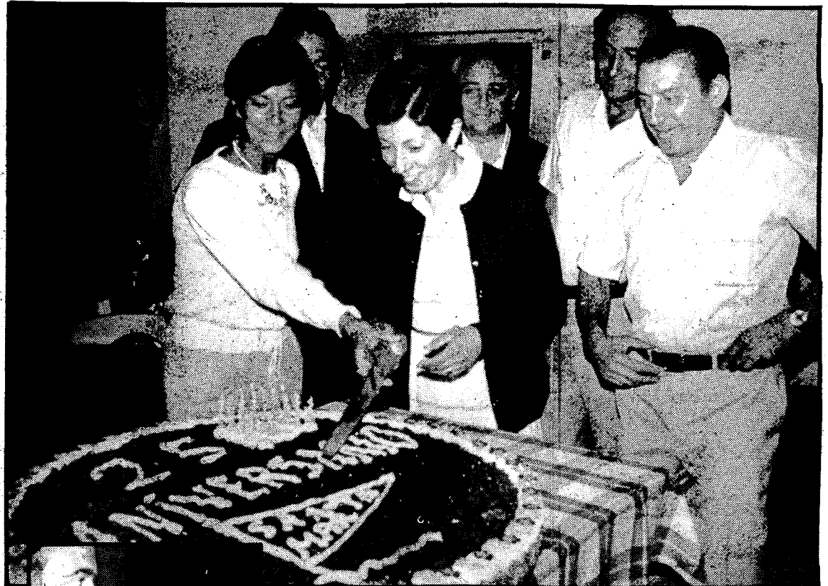
La cámara de Romaní captó diversas imágenes del desarrollo de la velada.