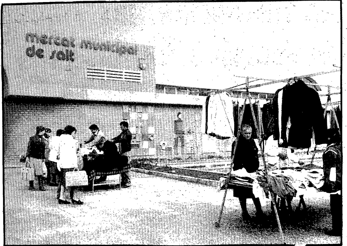
Desde ayer y con carácter semanal, frente al mercado de Salt, funcionará un mercadillo para mejor servicio de las amas de casa de la vecina población. Pese a que se inicia en unos xmtos de bajas temperaturas los y las saltenses acogieron muy bien esta iniciativa municipal.