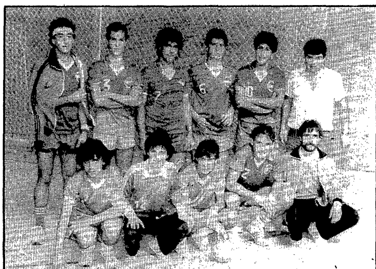
El Garbí de Palafrugell ha quedat cinquè en el seu primer any de participant a la lliga provincial sènior d'handbol.