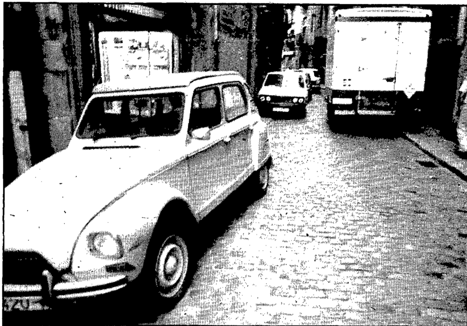
Espectacles com aquest ja no es veuran més al carrer dels Calderers.