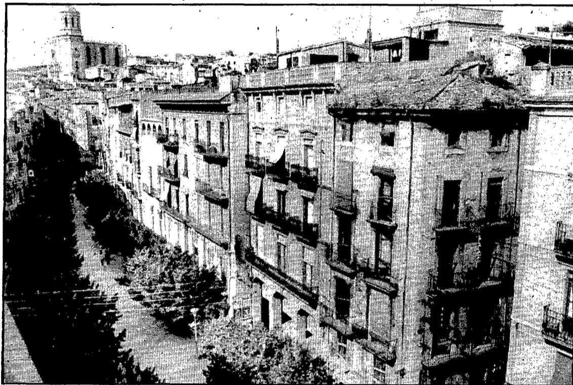
La Rambla esdevindrà un passeig exclusivament per a vianants.

Aquesta supressió de voreres a l'eix Ciutadans-Cort Reial-Ballesteries-Calderers no es podrà