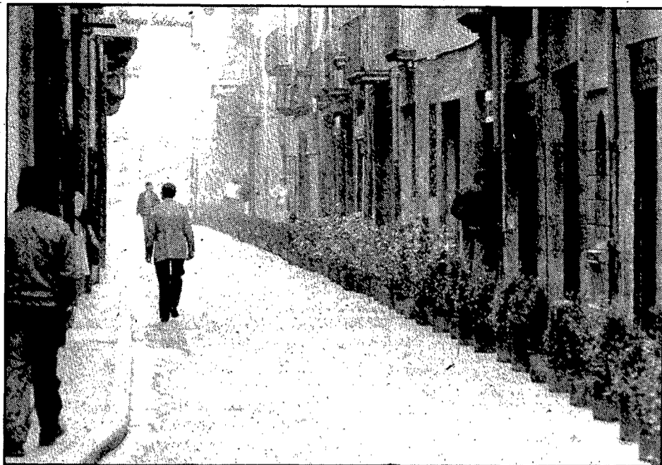
Els testos del carrer de les Ballesteries es substituiran per uns de més sòlids i s'estendran al carrer dels Ciutadans.

També es posaran testos al carrer dels Ciutadans