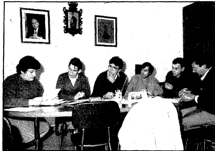
El ple del consistori decidí trametre una carta a la Creu Roja explicant la problemàtica de les despeses

No volen ser els únics a sufragar-ne les despeses