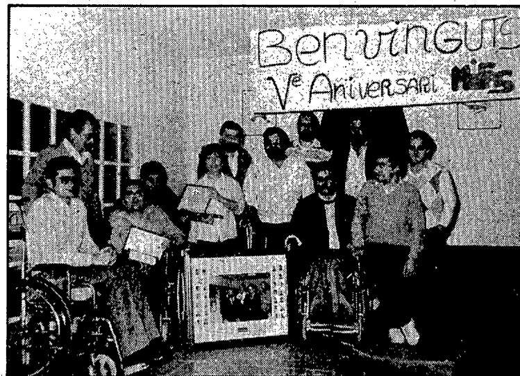
Al Mas Rourell celebraren el cinquè aniversari de MIFAS. (Foto JULI).

La gresca i l'ambient alegre de socis i acompanyants féu que el dia ennuolat no fos motiu perquè MIFAS amagués el seu esperit i