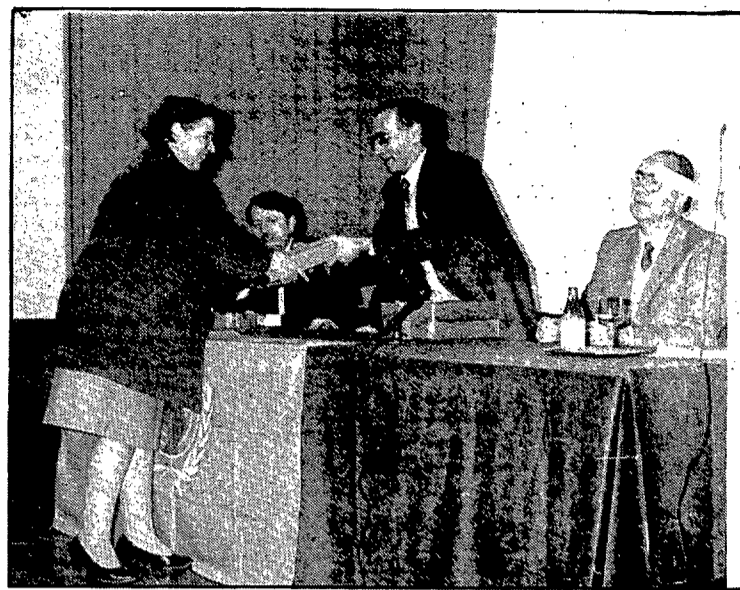
Un moment del lliurament d'obsequis en l'aniversari de la UNICEF a Girona.