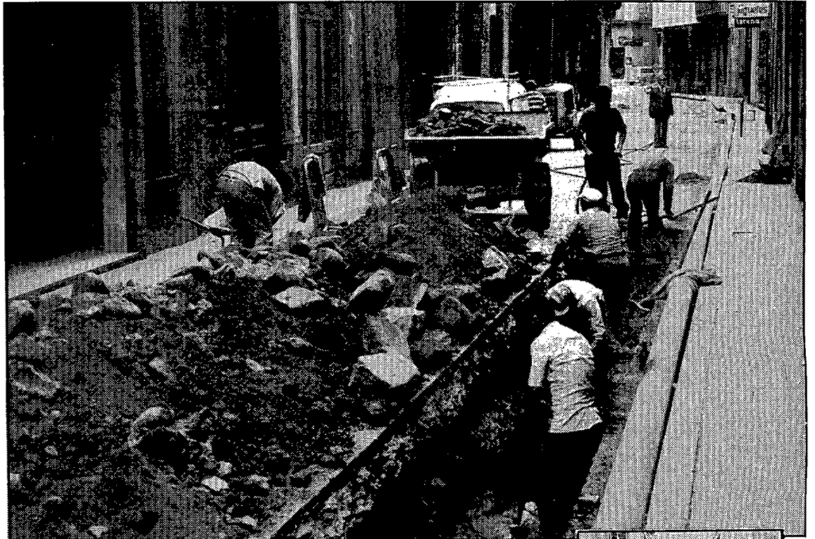
De nuevo, obras en la calle Ciutadans.

A partir de hoy, las calles Ciudadanos y Calderers, quedarán cerradas al tránsito rodado. La calle Ciudadanos para poder hacer diversas obras en el alcantarillado cercano a la Fontana d'Or, y la calle Calderers para arreglar un hundimiento en la calzada.