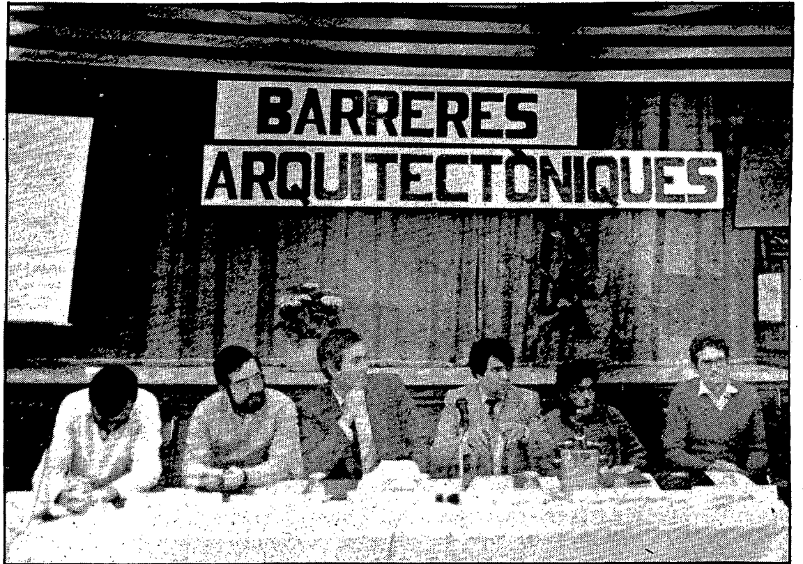
Presidència de la taula rodona.