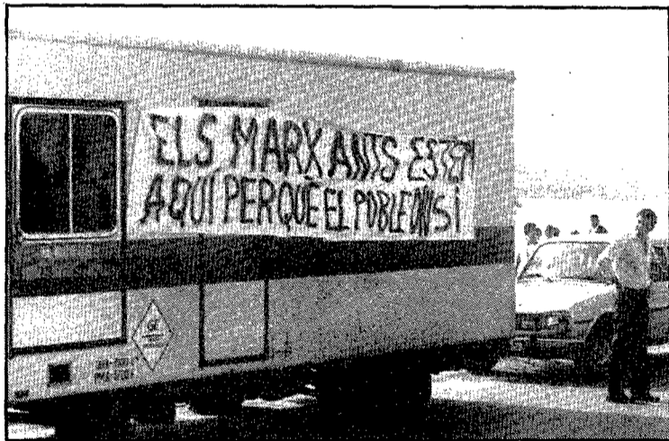
Els marxants no pararen diumenge a l'Escala, però continuaren les protestes en forma de pancartes i d'escrits.

Després de dos diumenges de tensions en instal·lar els marxants il·legalment les seves parades al passeig de l'Escala, amb presència de la força pública, diumenge passat no van parar enlloc. Es limitaren a deixar les camionetes al passeig amb pancartes penjades que feien al·lusió al problema que els enfronta des de fa mesos amb l'Ajunta-