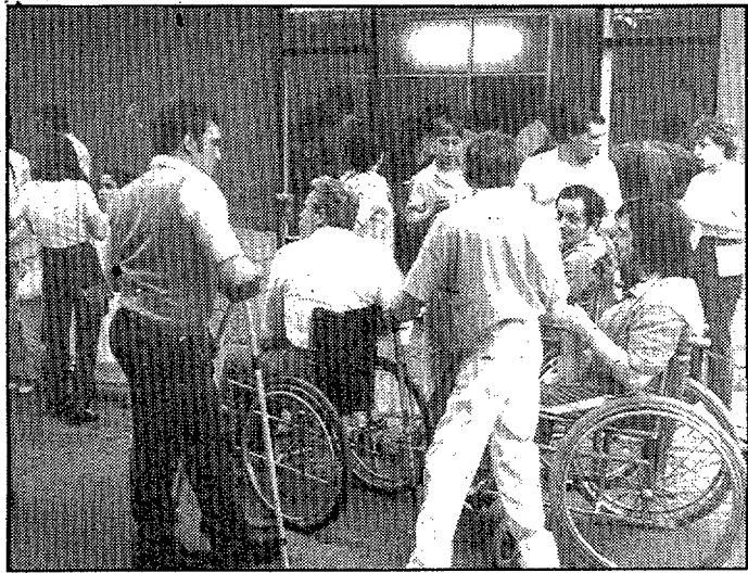
El nou local es troba situat al carrer d'Olot.