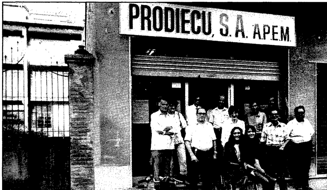
Els venedors de les butlletes de Prodiecu, S.A. es reuniren ahir a la tarda a la seu de l'empresa a Girona.

Des de la delegació de l'ONCE a Girona es té el convenciment