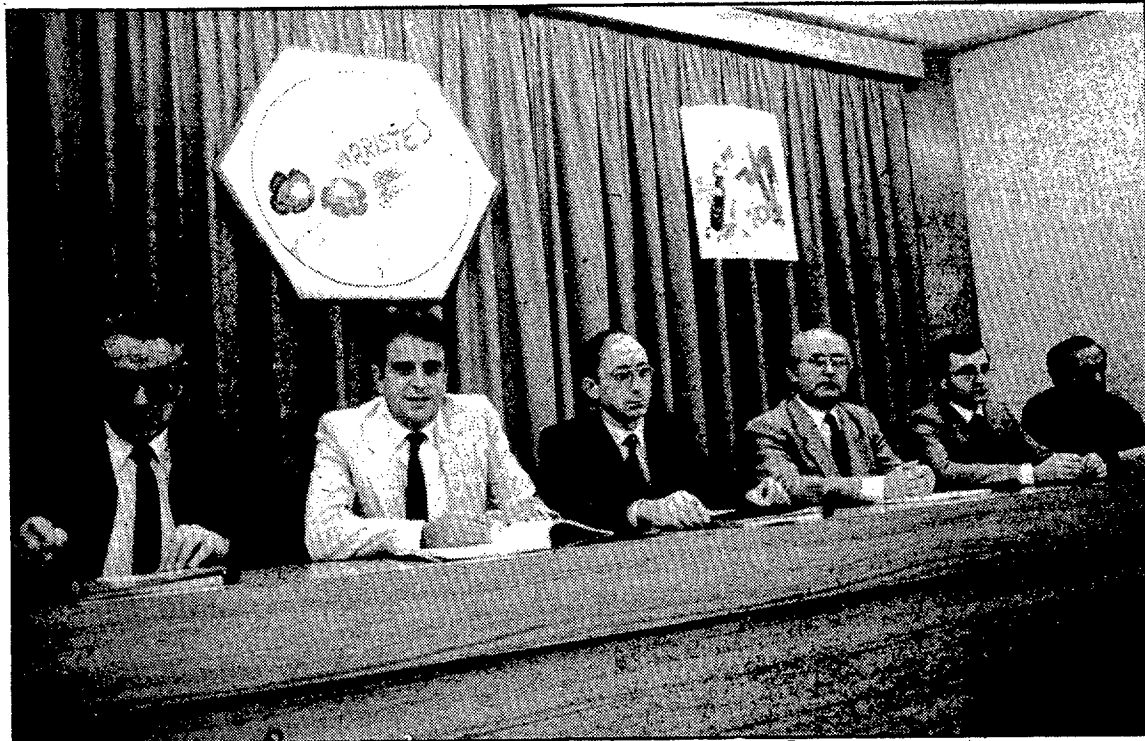
Ayer se presentaron los actos del primer centenario de la llegada de los Hermanos Maristas.

A última hora de la tarde de ayer, y en el colegio La Inmaculada de los Hermanos Maristas, tuvo lugar una rueda informativa al objeto de presentar los actos con los que la familia Marista celebra el primer centenario de la llegada de los Hermanos a España. Y más concretamente a Girona.