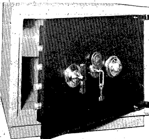
MODELO - 80