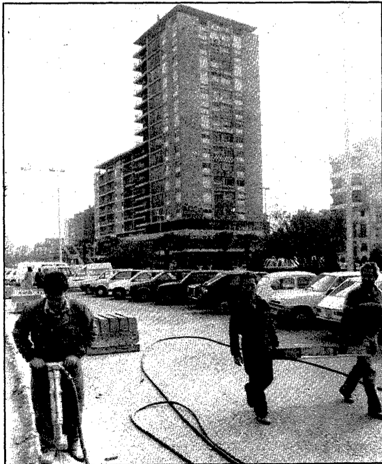
Un cop feta la tanca per a l'aparcament, s'ha comprovat que era antiestètica i incòmoda.

Han tret les peces de formigó de la plaça de Catalunya