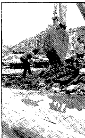
Les peces de formigó de la plaça de Catalunya ja han estat substituïdes.

AMB LOCUCIONS DE SONIA F.M. Sintonitzi'ns!! En el nostre programa pot passar... qualsevol cosa!