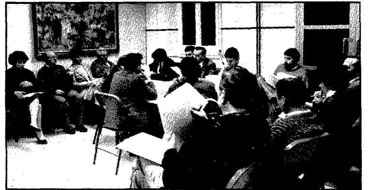
De manera provisional, es va haver d'habilitar l'entrada a la segona planta del nou ajuntament per celebrar la sessió.

També se sol·licitaren subvencions a l'organisme estatal per a