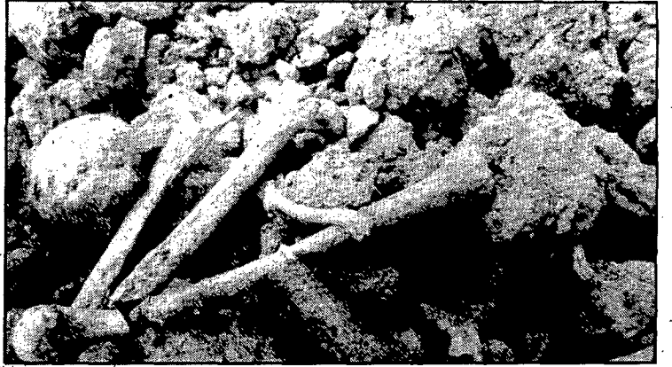
Tots els ossos ja es troben recollits en una dependència del cementiri municipal.

El cap del Patrimoni ha assenyalat: «No sé exactament la quantitat d'ossos recollits fins ara, però els guardem en unes caixes tal com cal tractar sempre les restes humans. També ha dit que és possible que alguns veïns de pels voltants de les excava-