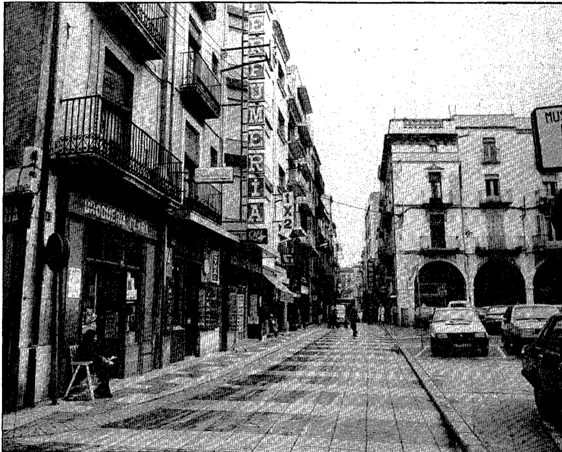
L'enllumenat públic i l'aigua potable de Figueres ja és competència de Fisera.

Parquímetres a la tardor Malgrat que actualment només