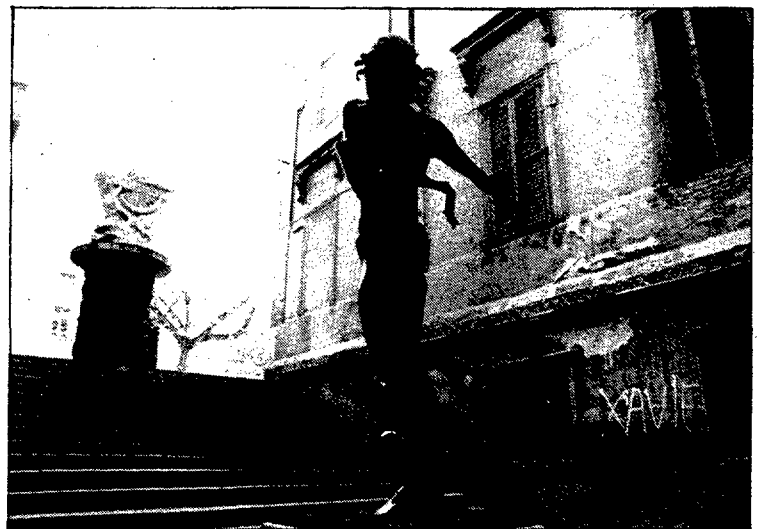
L'escultura de Dalí col·locada fa menys d'una setmana a Figueres ja ha estat espoliada.

L'espoliació del «Newton de Gala» va tenir lloc dilluns a la tarda a plena llum del dia, i quan la zona era força concorreguda.