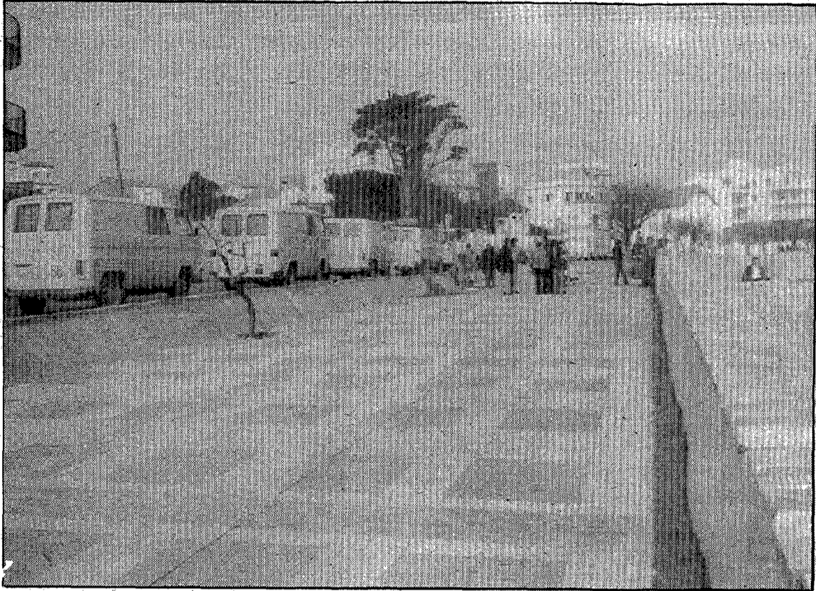
El pla general de l'Escaladeu ha estat aprovat definitivament per Urbanisme amb algunes modificacions que no convencen a l'Ajuntament.