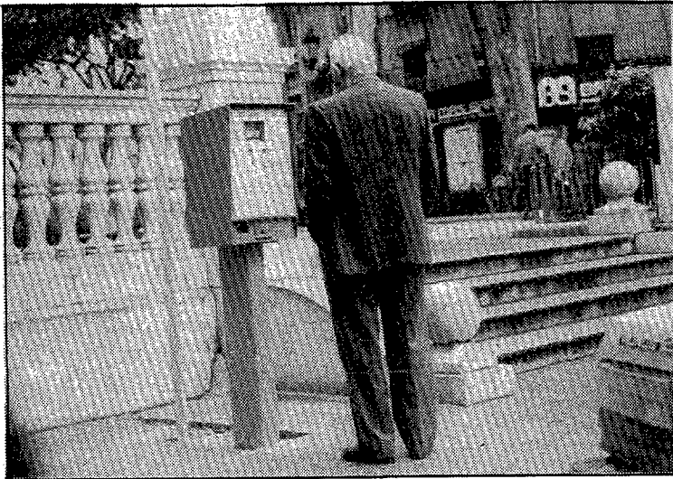
El ciutadà, de moment, ha rebut bé la regulació dels aparcaments del centre de Figueres mitjançant parquímetres.

Aquest fet també ha estat observat pels botiguers de la zona,