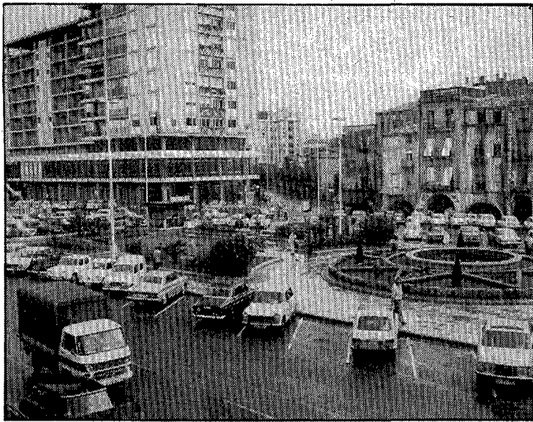
Más plazas de aparcamiento.