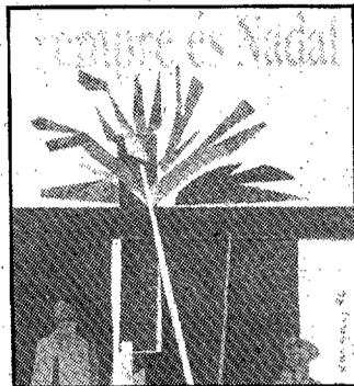
Ésta es la portada del libro.