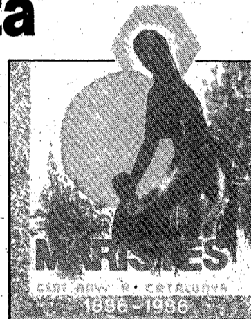
Cartel de la fiesta marista.

Durante la matinal del domingo se celebrarán dos confrontaciones deportivas. Por una parte el equipo de baloncesto juvenil del centro se enfrentará al Palamós; y en fútbol se disputará un partido entre los juveniles de los Maristas y el equipo de Sant Esteve d'en Bas. Los actos más importantes se celebrarán el lunes día ocho. A las diez de la mañana, se oficiará una misa en la gran sala del Colegio. A las once menos cuarto, se inaugurará la exposición «Memòria de cent anys de presència Marista a