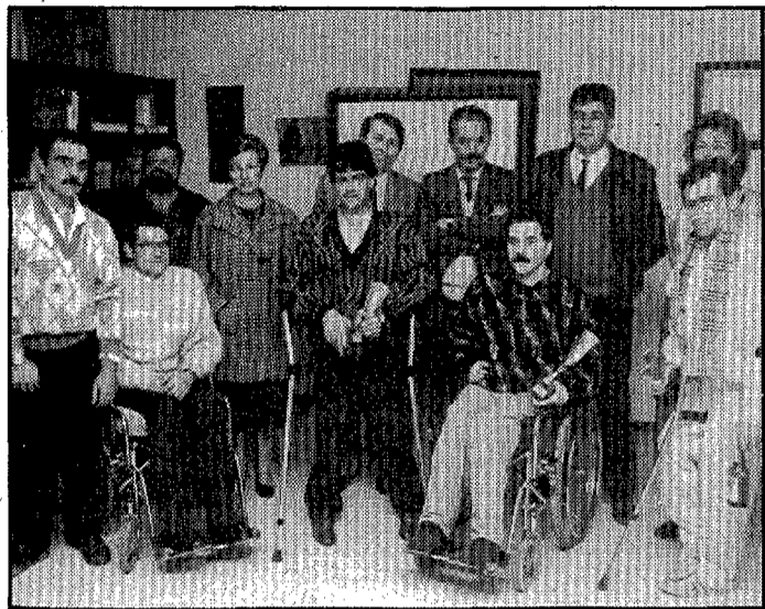
Día de fiesta y reparto de premios.