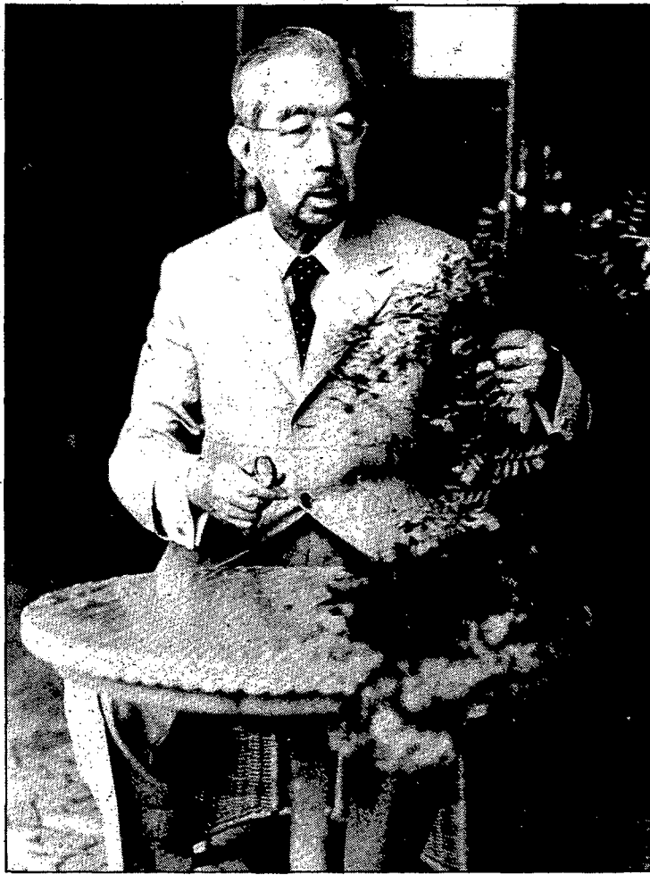
La botànica és un dels principals entreteniments de l'emperador.

Rodejat de clans militaristes amb deliris expansionistes, convençuts que l'Imperi del Sol Naixement està cridat a regir els destins d'Àsia, Hiro Hito es veu arrossegat a una agressiva política exterior. És l'època de l'ocupació de Manxúria i la intervenció militar a la Xina, amb l'ocupació del Nanquín, Canton i Hainan. Més tard vindria la participació del Japó a la II Guerra Mundial i les bombes atòmiques sobre Hiroshima i