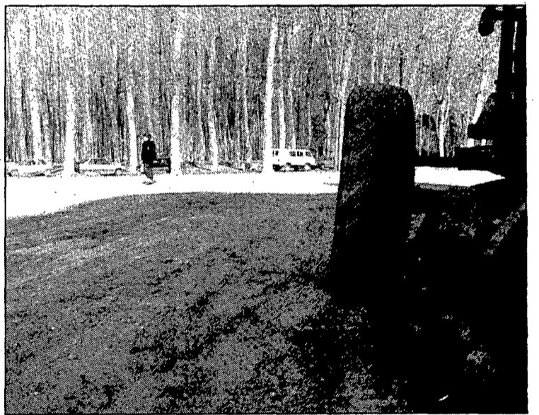
Els treballs per arranjant l'antic llit de Güell, davant dels tallers Sarassa, ja han començat.

Per altra banda, a partir del set de gener ja no es podrà aparcar a la plaça de Josep Pla, pàrquing que fins ara ha estat explotat MIFAS, igual que el de la plaça de Catalunya. La concessió de l'edifici Grober fa impossible que