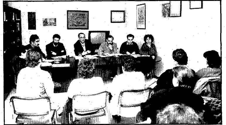
Presentación de la nueva junta de la federación.

Los objetivos de la «Federació gironina d'afectats físics, orgànics i sensorials» son «conseguir me-