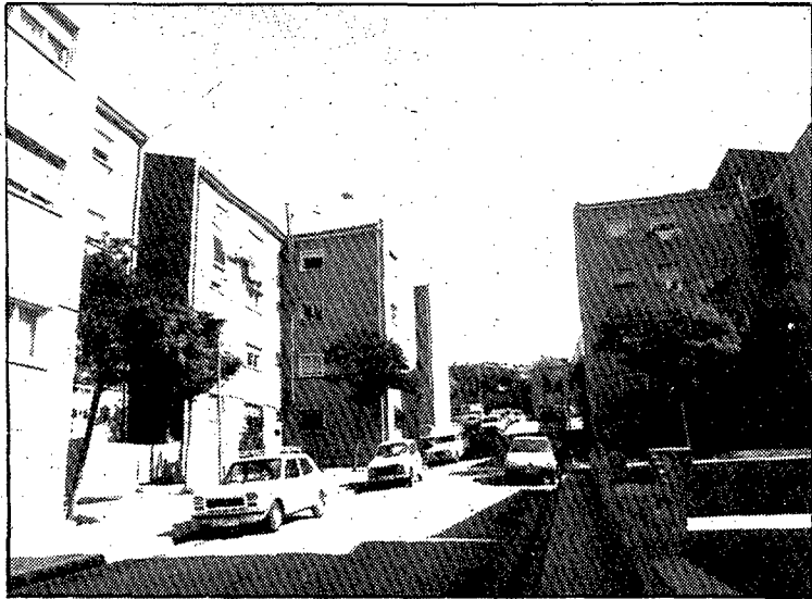
Se aprobó el plan de atención a familias de Font de la Pólvora.

calzada lateral de la carretera Nacional II desde el inicio del municipio gerundense hasta el antiguo cruce de la carretera de Santa Coloma.