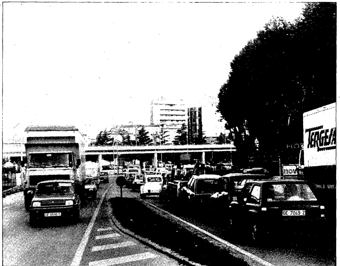
Reordenar la circulació en els accessos a la ciutat és un dels objectius fonamentals de l'estudi.

El darrer estudi sobre la circulació a les entrades i sortides de la ciutat va ser fet l'any 1981 per INTRA i ICEG i determina que el trànsit Est-Oest era gairebé