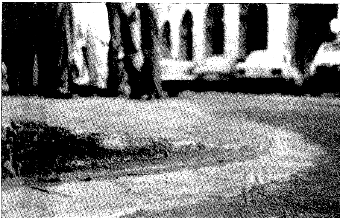
A la Plaça Independència ja s'han rebaixat les voreres per facilitar l'accés als minusvàlids i gent amb dificultats físiques.

El capità general de Catalunya, Baldomero Hernández Carreras, es va acomiadar dijous de les autoritats gironines, entre elles l'alcalde, Joaquim Nadal. El capità general portava prop d'un any en el càrrec i va manifestar que «es trobava encara en plena forma i molt content d'haver passat l'última etapa de la vida militar a Catalunya». Va desitjar per als gironins «molt pau i molt de treball».