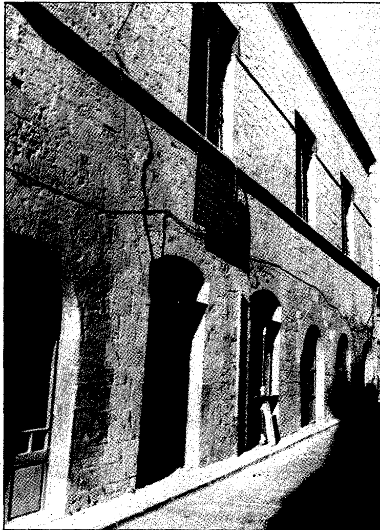
Els locals de Can Cambó són insuficients per emplaçar-hi el Centre de Salut comarcal.

D'acord amb les condicions que posava l'ICS, les instal·lacions de Besalú havien de disposar d'un espai de 580 metres