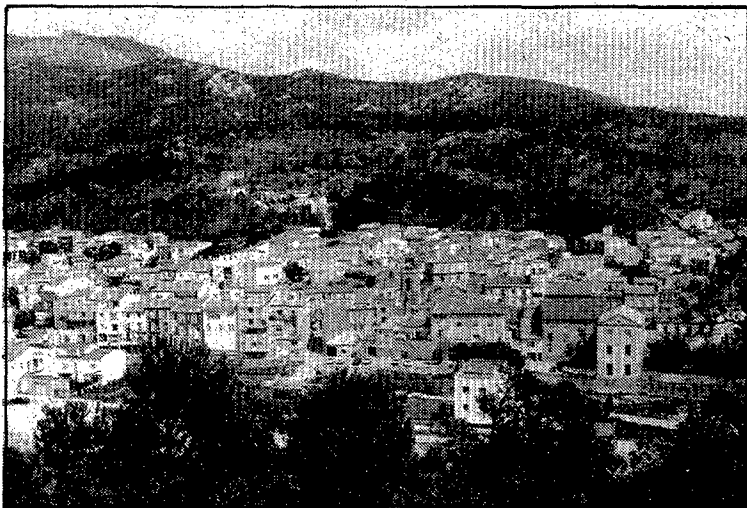
La multinacional francesa Total instal·larà una gasolinera a la Jonquera.

La intenció de la casa Total és establir-se a la Jonquera el més aviat possible, tot i que ja s'han mantingut contactes per arribar a un acord amb l'Ajuntament i, si els convé, fer una permuta de terrenys, amb l'objectiu que es pogués disposar del projectat aparcament de camions i l'empresa construiria la gasolinera en un em-