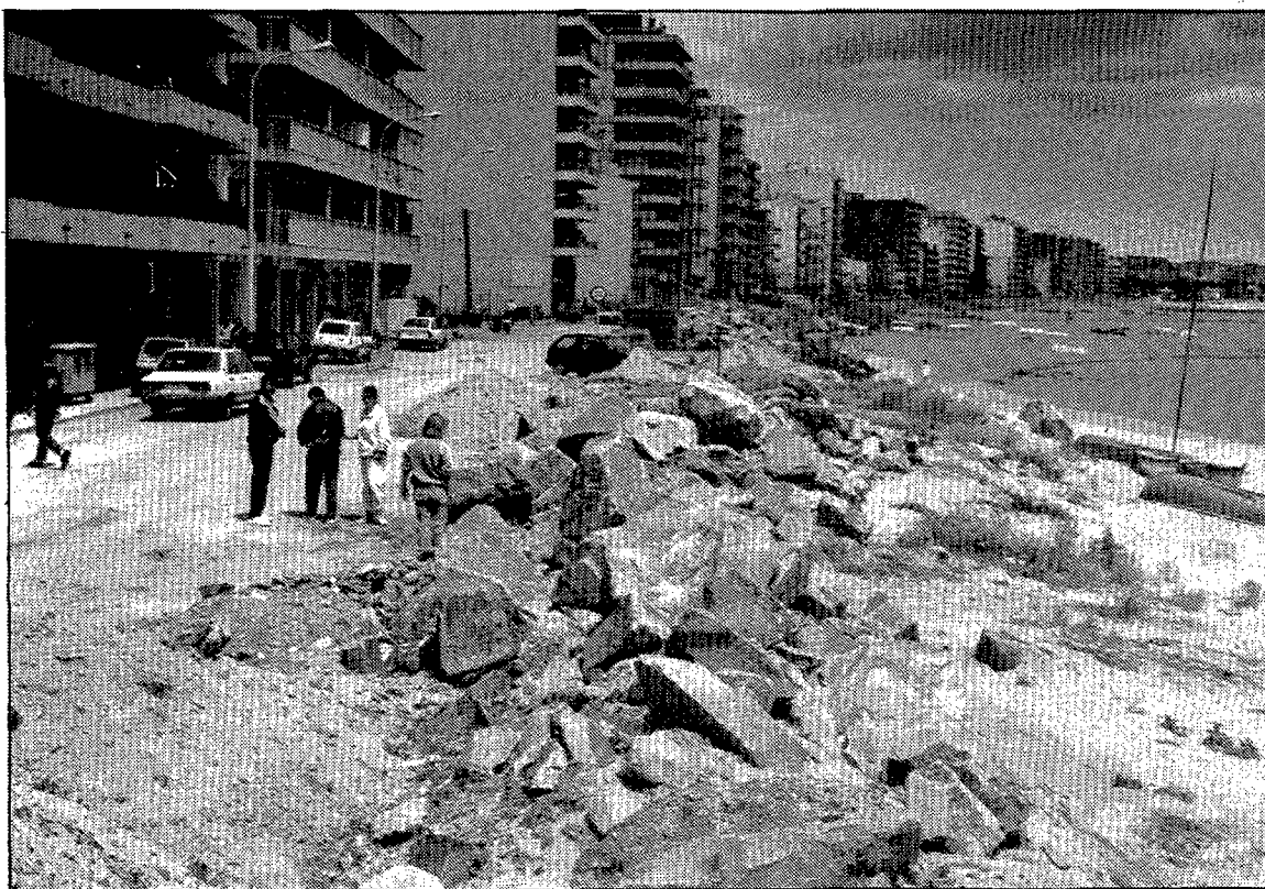
El passeig marítime de Sant Antoni de Calonge ha estat en obres fins al mes de juliol, i els treballs es reprendran després de l'estiu.