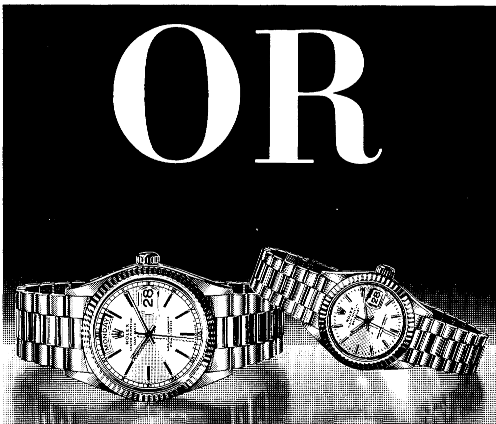
Cronòmetres Rolex Day-Date i Rolex Lady-Datejust, d'or de 18 quirats, amb braçalet President que hi fa joc.

Vagi a veure al seu concessionari Rolex i demani-li tota mena de detalls. Ha estat curosament escollit per a representar a Rolex i donar-li servei.